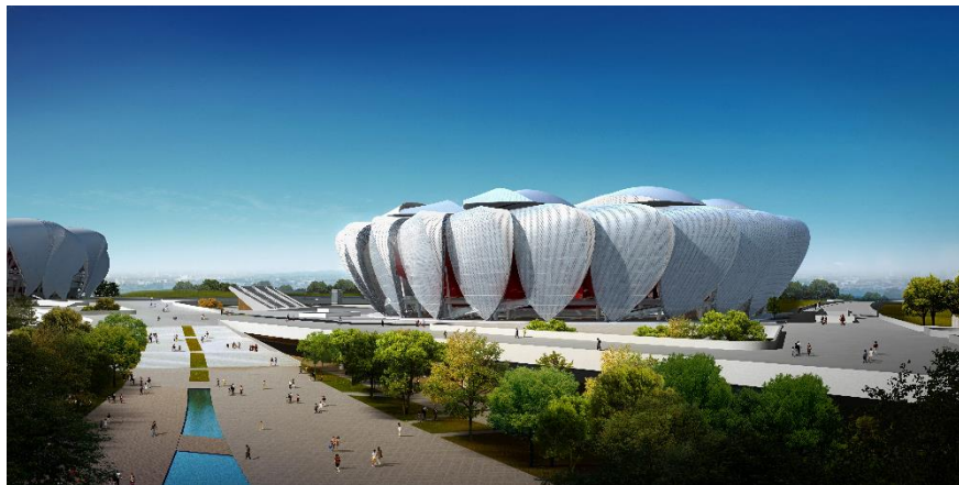
杭州奧體中心網球中心